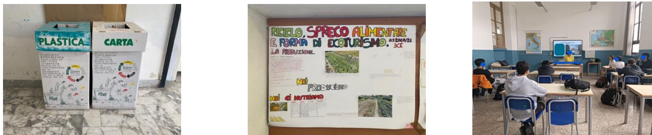
Fig. 2: immagini delle visite esplorative

Le visite esplorative sono state accompagnate da un "vademecum per il ricercatore" in cui era specificato cosa osservare (sia all'interno dell'istituto, sia in classe, sia nel contesto in cui la scuola era inserita) e come registrare i dati (principalmente note di campo, diario di ricerca, fotografie).