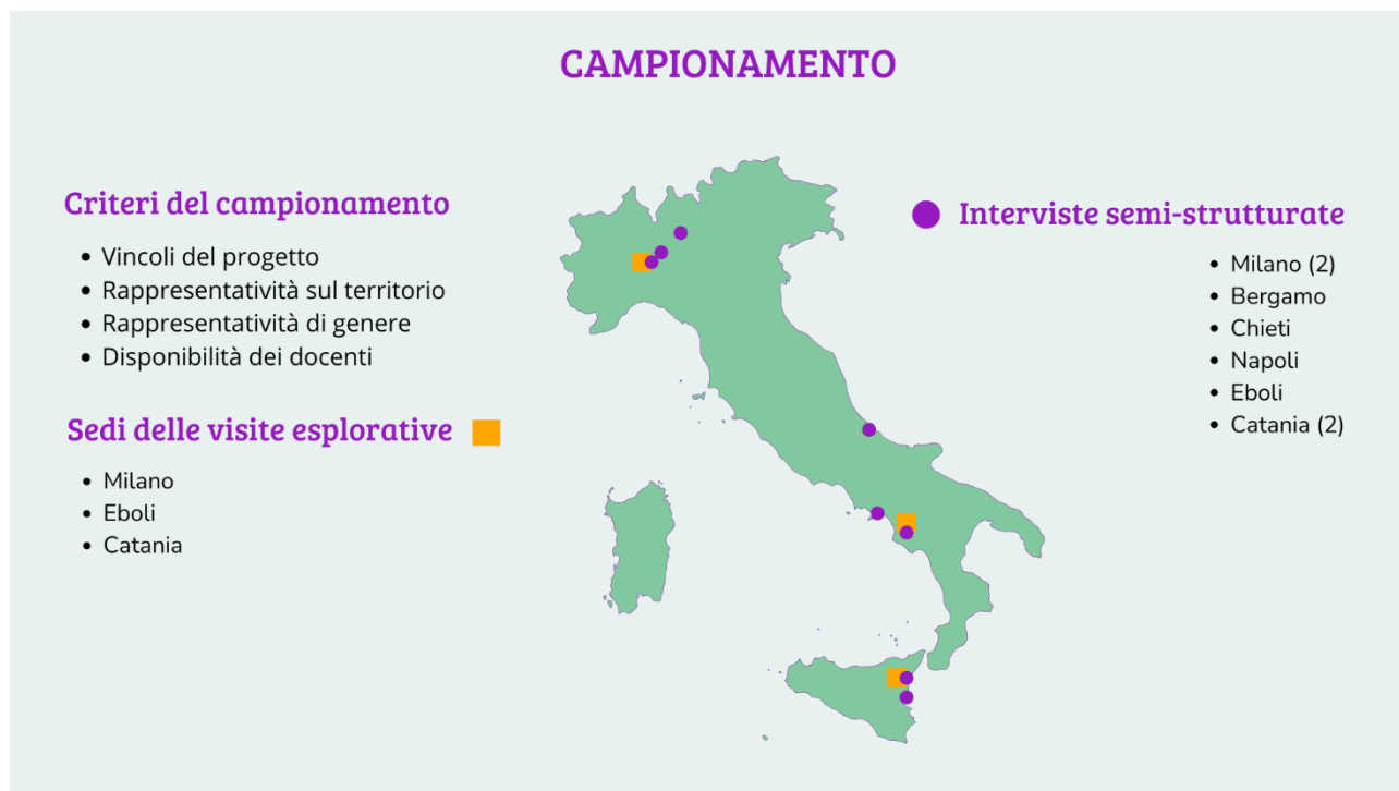
Fig. 1. Campionamento

Per quanto possibile si è cercato di differenziare anche la tipologia degli Istituti di provenienza dei docenti: le visite si sono svolte in un liceo e in due istituti tecnici; le interviste hanno coinvolto tre docenti di licei e cinque di istituti tecnici. Riguardo al genere invece cinque erano donne e due uomini.